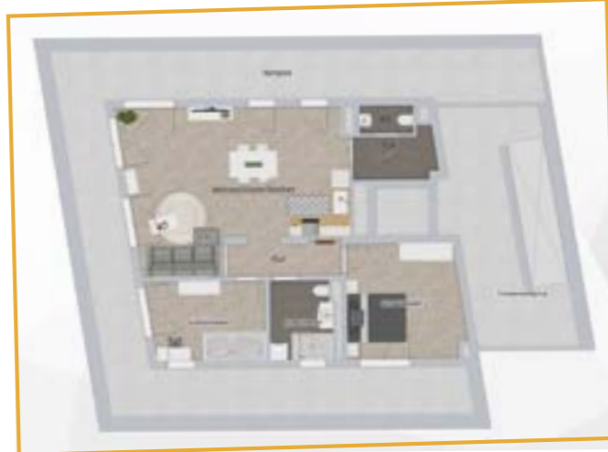
Grundriss* Penthouse Badergasse 14